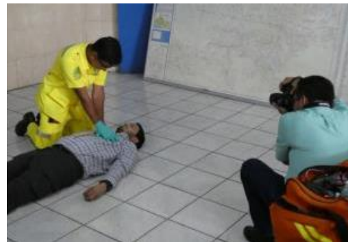
Toma de fotografías para el manual de entrenamiento