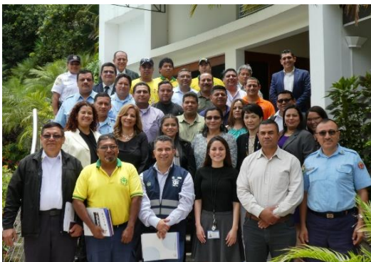
Foto de grupo en la reunión del equipo técnico 1