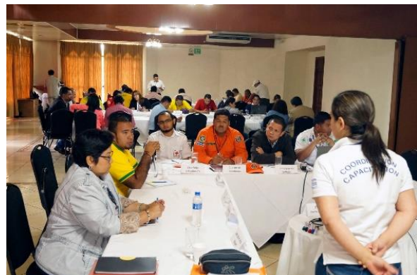
Taller para el diseño de un curso de capacitación y el desarrollo de una lista de verificación y el cumplimiento de las directrices en el ámbito prehospitalario