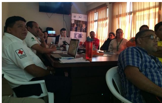
Reunión del equipo técnico1